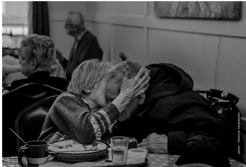
En 2031, 1 Québécois sur 4 sera un aîné. Le quart de la population!

La série commence avec un rappel nostalgique de la manière dont on s'occupait des vieux autrefois. Le réalisateur ressort de belles images du film de Pierre Perreault, Pour la suite du monde , pour évoquer le temps où le placement des personnes âgées n'était pas un enjeu, car les familles étaient nombreuses, les communautés religieuses très impliquées dans les soins de santé, et on mourait beaucoup plus jeune.