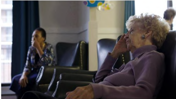
Qui payera pour les soins dont les personnes vieillissantes auront tôt ou tard besoin?

Aussi, qui payera pour les soins dont les personnes vieillissantes auront tôt ou tard besoin? Le gouvernement peine déjà à le faire, et ce n'est pas tout le monde qui peut se payer les services que le système public délègue au privé. Est-ce qu'on se prépare à une vieillesse à deux vitesses? Et que deviendront les CHSLD, qui souffrent déjà de sous-financement, où, pourtant, les listes d'attente ne cessent de s'allonger?