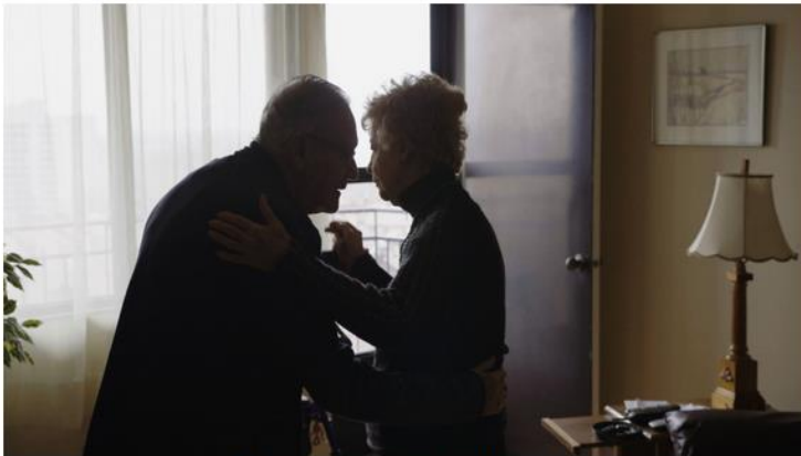
Tous les épisodes de la websérie L'industrie de la vieillesse seront disponible gratuitement à compter du 3 mars sur ICI Tou.tv.